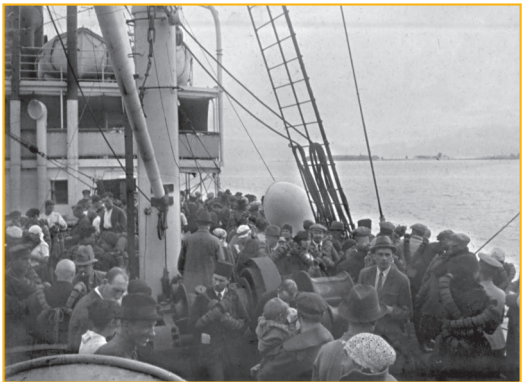
L'exode russe : départ de Yalta (1919)