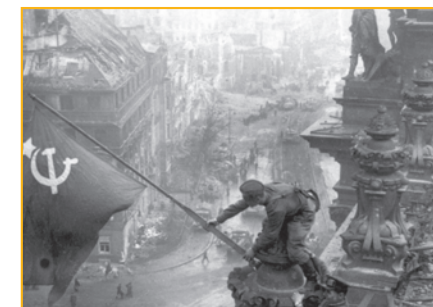
Drapeau soviétique sur le Reichstag Evgueni Khaldei

■ LES DOCUMENTAIRES D'ARTE programme sur www.association-des-historiens.com