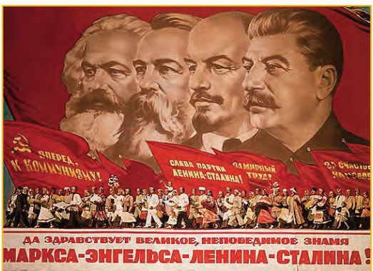
Marx, Engels, Lénine, Staline