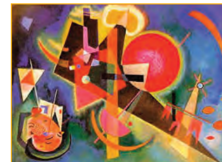
Dans le bleu Vasily Kandinsky

■ LES DOCUMENTAIRES D'ARTE programme sur www.association-des-historiens.com